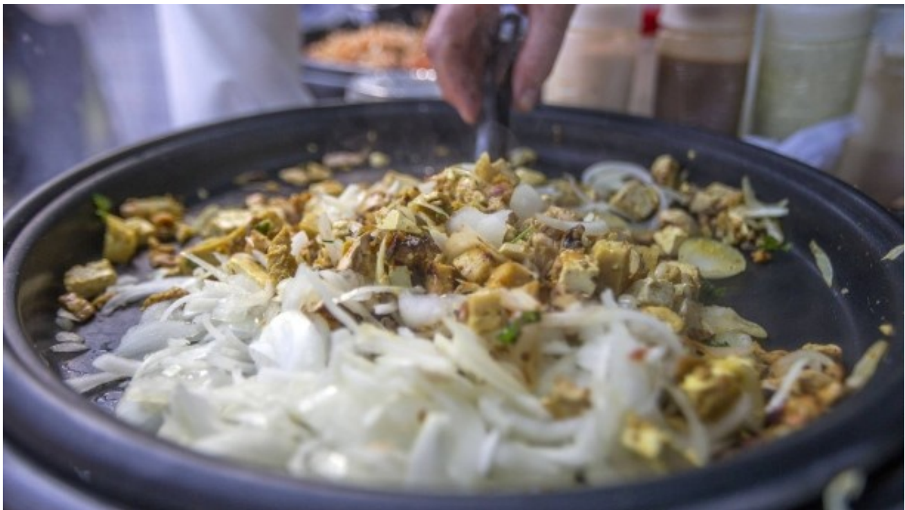
Tacos ganz vegan: Passt zur koscheren Küche

Dessen Grundregel fordert, Fleisch- und Milchprodukte zu trennen. Wer in Israel also auf die Fleischbeilage verzichtet, isst zwangsläufig kein vegetarisches, sondern gleich ein veganes Gericht. Zwischen dem Verzehr eines Steaks und einem Stück Käsekuchen müssen sechs bis acht Stunden liegen.